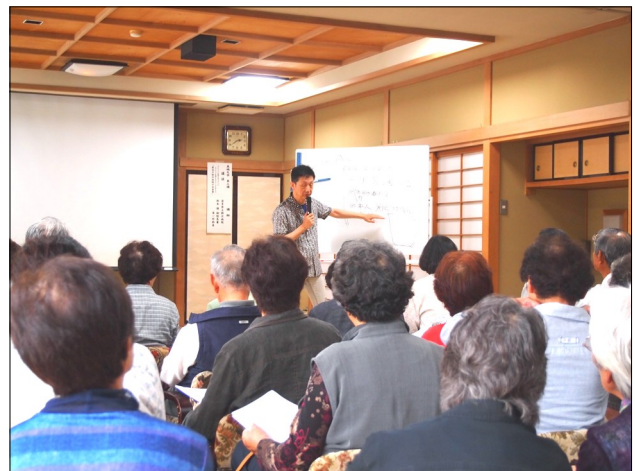
真城地区センター