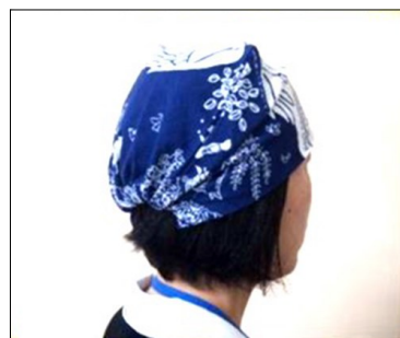
今回は写真のような帽子をバンダナで作りました(イメージ)