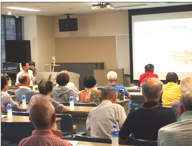
水沢地区センター

出前医療講演は35のメニューを用意しております。ご利用をお待ちしております。(メニュー等詳しくは胆沢病院のホームページをご覧ください。)【お問合せ先:胆沢病院地域医療福祉連携室 電話0197-24-4121】