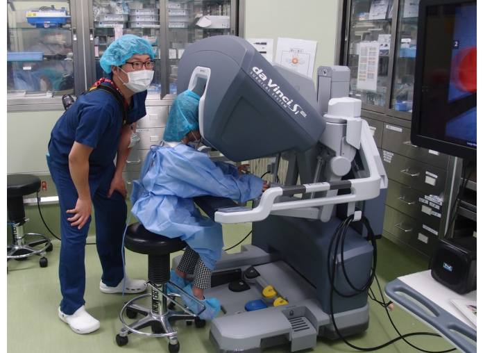
実際に操作体験。某医療ドラマでは似たような器械を「ダーウィン」と呼んでいました。