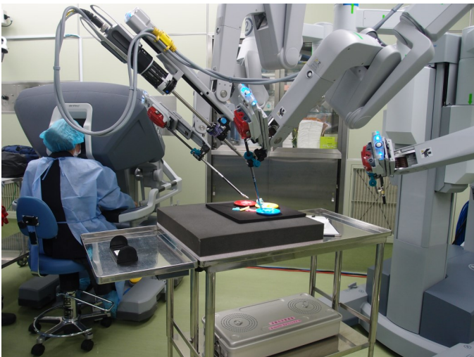
左側のコンソールで操作、右側のアームが動きま す。