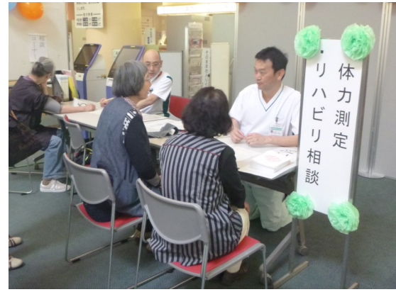
リハビリ相談・体力測定