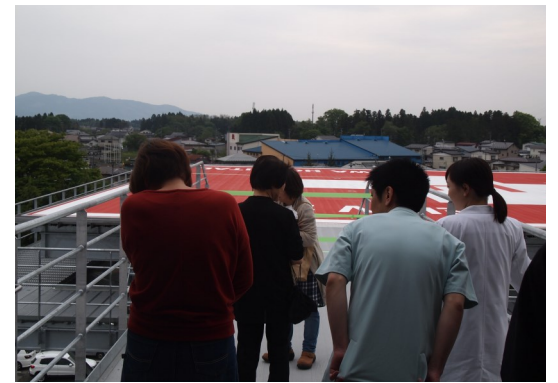
ヘリポート見学 (高さはビルの3~4階位)