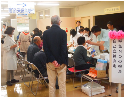
肺機能の検査など大盛況でした

5月12日(土) 第1回 岩手県立胆沢病院祭、平成30年度「呼吸の日」市民講座が開催され、多くの方に来院していただきました。当日の様子を写真で紹介します。