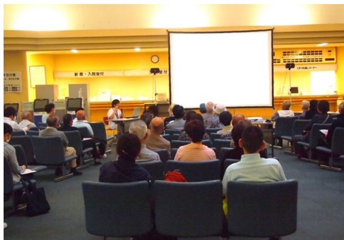
たくさんの方にお越しいただきました

医療情報コーナーでは、がんやその他の疾患に関して毎月第4火曜日に各部門のスタッフが担当し勉強会などのイベントを行っていますので、お気軽にご参加ください。また、がんに関する不安や悩み、疑問などについての相談を「がん相談支援センター」で受けております。