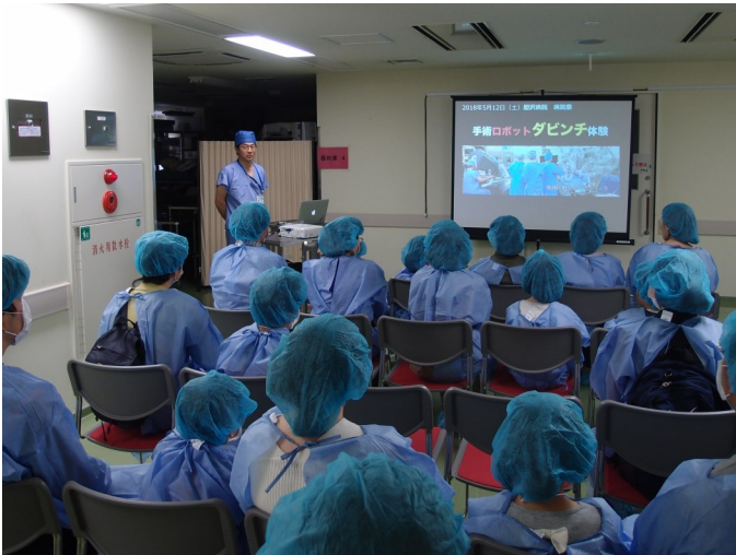
手術支援ロボット「ダヴィンチ」の操作体験。 10名の申込は受付開始後すぐに終了してしまいました。はじめに説明を聴いてから体験です。