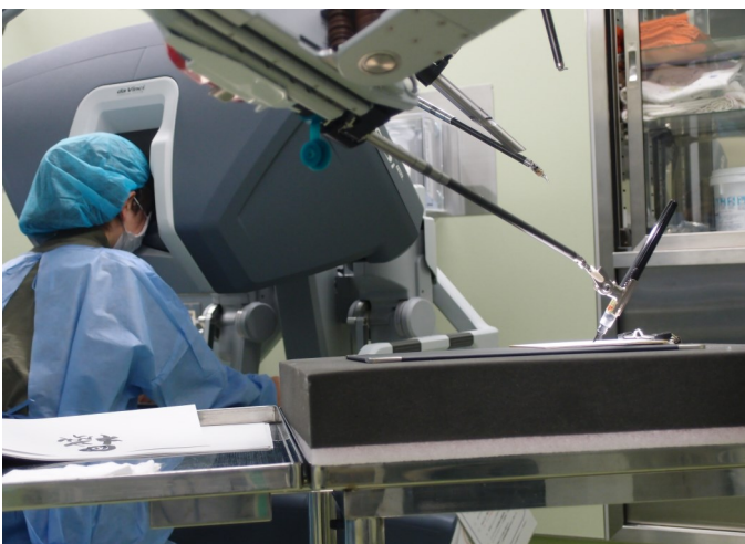
ダヴィンチのアームに筆ペンを付けて操作すると