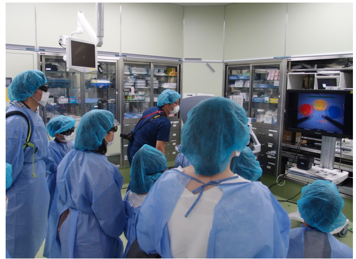
見学者は3Dメガネをかけてモニター画像を立体的 に見ています